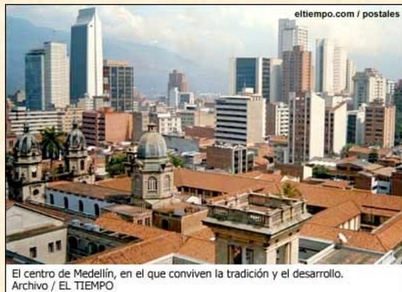
El centro de Medellín, en el que conviven la tradición y el desarrollo.